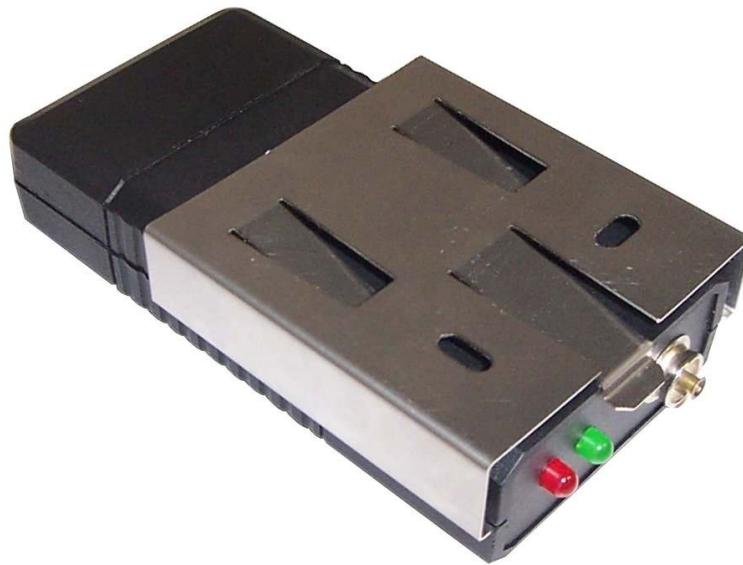
Kép: Biztonsági jelző tartó Cikkszám: 7100.181.H