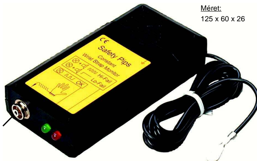
Méret: 125 x 60 x 26

Szabvány: 10mm-es patent Cikkszám. 7100.181 Opció: 4mm-es banándugós Cikkszám: 7100.181.B